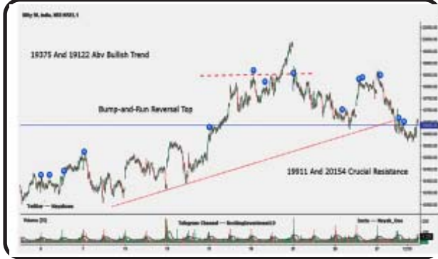
સમાહથી હુ ભારતીય શેરબજાર આર્ટીકલમાં સેન્સેક્સમાં ૬૫૪૨૨ ઉપર મજબુત તેજીની ચાલની ઉપર તેજી તરફી ચાલ જળવાઈ

આગાહી કરી રહેલ છે જે મુજબ જ મહત્વના બંને ઈન્ડેક્સમાં ફૂલગુલાબી ઐતિહાસીક તેજી જોવા મળેલ છે. અમારા મેમ્બર્સને ઈન્ડેક્સ ઓપ્શન અને ફ્યુચર્સમાં આપેલ ભલામણોમાં બહુ જ સારુ વળતર છેલ્લા ત્રણ માસમાં મેળવેલ છે. છેલ્લા સમાહના